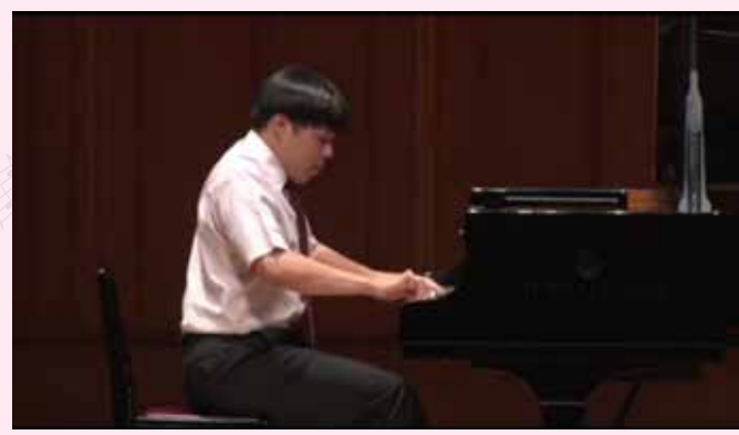
E級(年代ごとの階級)での演奏の様子